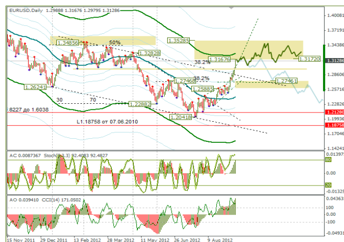
Рис. 2 МА каналы для дневного графика EURUSD

Агентство Egan-Jones Rating после запуска QE3 второй раз понизили кредитный рейтинг США. Первый раз они понизили США рейтинг 18.07.2011. На них рынок никогда не реагировал, так как считают это агентство неавторитетным, хотя они всегда иду на шаг впереди других агентств. Спустя некоторое время, следом за ними понижают рейтинги и другие агентства. Не думаю, что будет сильная реакция на это решение, но при текущем бычьем тренде в качестве драйвера могут использовать и эту новость.