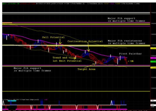
Диаграмма 2. Определение ключевых областей поддержки и сопротивления.

Для целей краткосрочной торговли, разработчики программы идентифицировали временные масштабы, которые работают лучше всего для определения подходящих уровней слияния. Индикатор, названный "Autofibs" автоматически вычисляет ключевые области на каждом временном масштабе. Затем трейдеры могут видеть на графиках, на каких ценовых уровнях эти области совпадают. Чем большее число раз ценовой уровень формирует линию на каждом периоде, тем существеннее он становится. Используя другой индикатор под названием "Accumulator", трейдеры могут выбирать, какой временной масштаб они находят наиболее полезным для их торговых целей и построить их на своем основном торговом экране (см. диаграмма 2) различными цветами, чтобы определить ключевые области поддержки и сопротивления.