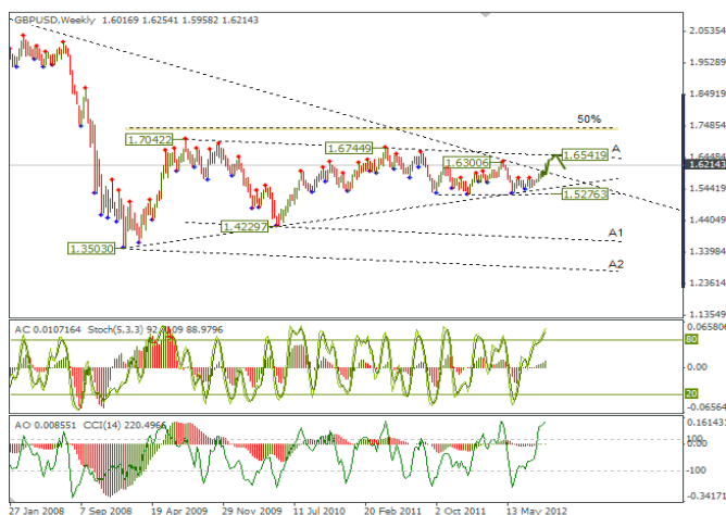
Рис. 3 Недельный график GBPUSD

На фоне решений ЕЦБ и ФРС США курс фунт/доллар пробил сопротивление 1,6134 и укрепился до 1,6254. По восходящему каналу цена достигла верхней границы, от которой цена может на время отскочить вниз. Пока цена торгуется выше 1,6134, на рынке сохранится тенденция к дальнейшему росту.