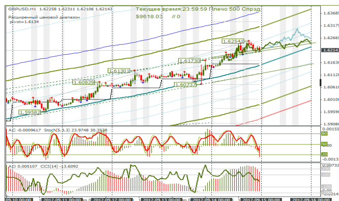
Рис. 1 МА каналы для часового графика GBPUSD

перевернутая голова-плечи, только масштабнее. Быки не собираются останавливаться на достигнутом. Какие мысли были по текущей ситуации, показал прогнозными сценариями. Может быть и слишком оптимистичные сценарии, но пока получается так.