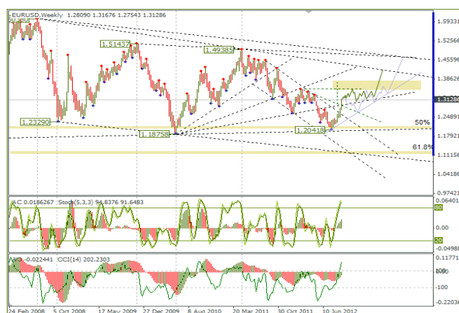
Рис.3 Недельный график EURUSD

Моделировал разные сценарии с циклами и мне не дает покоя возвращение цены на 1,2280. ЕЦБ и ФРС позволили евробыкам подняться выше 1,30. Но кто его знает, как сложится ситуация в будущем, может будет повод и для снижения. Первым звоночком к реализации сценария на снижение будет пробой 1,2950. Вторым, это падение к 1,2740. Падение ниже 1,26 вернет на рынок медвежьи настроения. М что самое интересное, это сценарий не получается с резким падением. Цена падает через сложную волновую структуру.