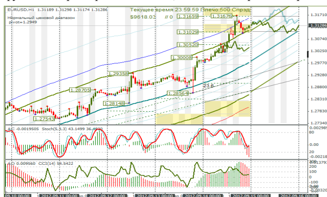
Рис. 1 МА каналы для часового графика EURUSD

По итогам торгов курс евро/доллар повышался до 1,3165, фунт/доллар добрался только 1,6254. Его сдерживал кросс.