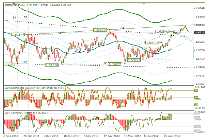
Рис. 2 МА каналы для дневного графика GBPUSD

В пятницу курс GBPUSD прошелся по основному сценарию. Резко уйти вверх быки не смогли, их сдерживал своим ростом кросс EURGBP. Из канала цена вышла и закрылась у линии U1 по 1,6214. По кроссу EURGBP назрел откат, поэтому если кросс на понедельник будет в союзе с фунтом, то по GBPUSD глубокого падения не ожидаю. При таком раскладе фунт сможет закрыться выше 1,6230. Что касается дневного графика, то там достигли значимого уровня сопротивления. По недельному тайм-фрейму ближайшая цель находится на отметке 1,6540.