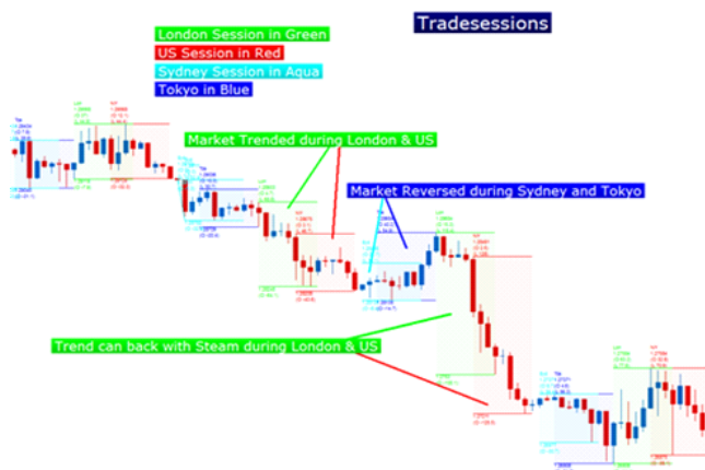
Диаграмма 2. Отображение различных торговых сессий на графике.