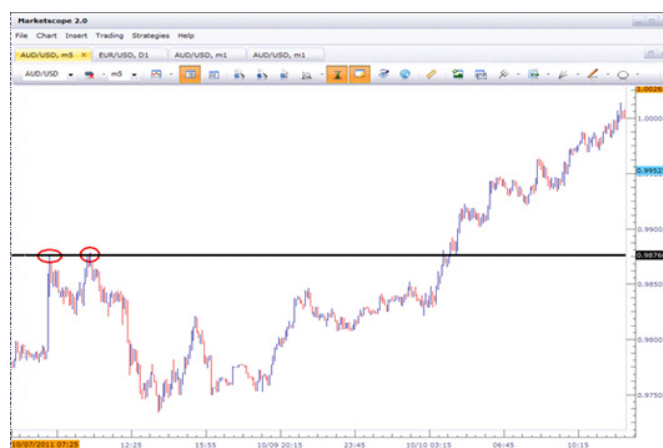
Диаграмма 3. Ценовой прорыв уровня сопротивления.

Ниже приведен пример ценового прорыва на валютной паре AUDUSD: